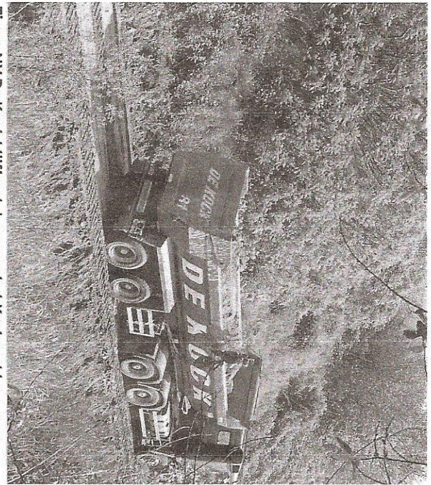
Firma NV De Kock blijft ontginnen op het Kerkeveld.